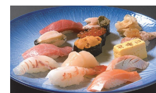
厳選にぎり ※イメージ