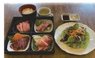
いわさき白老牛 ※イメージ