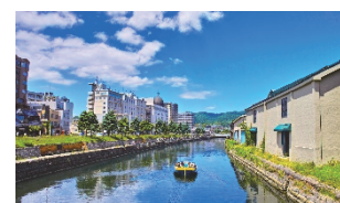
小樽運河クルーズ ※イメージ