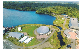
ウポポイ