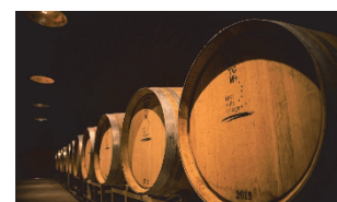
NIKI Hills Winery 樽庫 ※イメージ